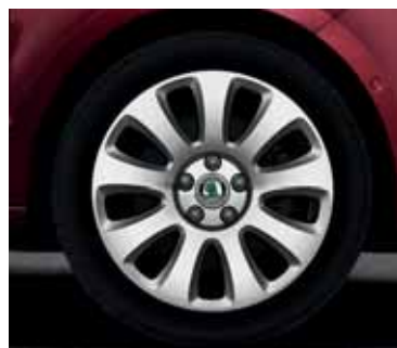
Disk z ľahkej zliatiny Callisto 7,5J x 17" pre pneumatiky 225/45 R17 (CCR 800 003)