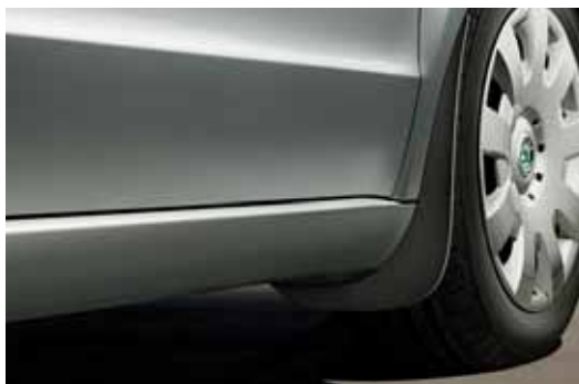
Predné lapače nečistôt (KEA 800 001)