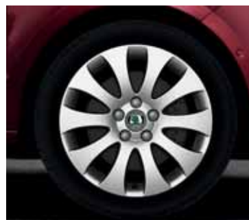
Disk z ľahkej zliatiny Venus 7,0J x 17" pre pneumatiky 225/45 R17 (CCR 800 002)