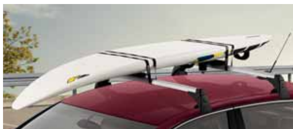
Základný strešný nosič pre model Superb (LAS 800 001) Držiak surfovej dosky (LBT 009 007)

Interiérový držiak 2 cestovných bicyklov pre model Superb Combi, určený pre montáž do vnútorného priestoru medzipodlahy (3T9 056 700)