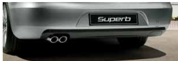
Difúzor (FAA 800 002) Koncovka výfuku z ušľachtilej ocele pre 1,4 TSI (FDC 610 001); pre 1,9 TDI (FDC 620 001)