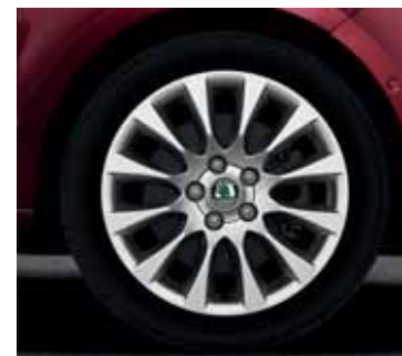
Disk z ľahkej zliatiny Laurel 7,5J x 17" pre pneumatiky 225/45 R17 (CCX 800 002)