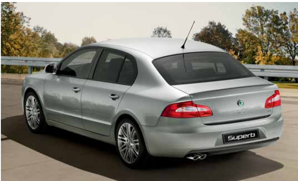
Styling kit pre model Superb; spoiler 5. dveri (FAA 800 001)