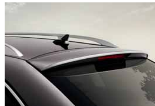
Strešný spoiler pre model Superb Combi (3T9 071 605)