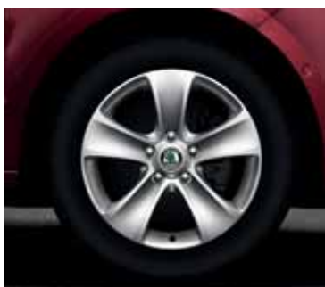
Disk z ľahkej zliatiny Moon 7,0J x 16" pre pneumatiky 205/55 R16 (CCR 800 005)