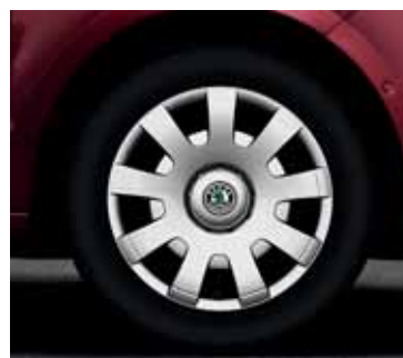
Veľkoplošné kryty Rif pre kolesá 7,0J x 16", štvordielna sada (CDB 800 001)