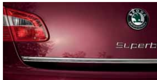
Chrómovaná lišta 5. dveri pre model Superb (KDA 800 003)