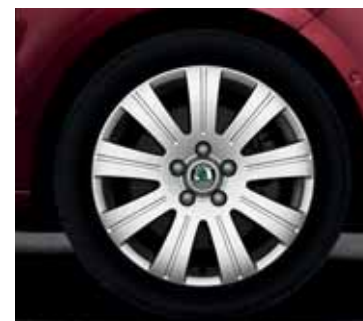
Disk z ľahkej zliatiny Flash 6,0J x 17" pre pneumatiky 205/50 R17 (CCX 800 003) – vhodný pre použitie snehových reťazí (CEP 800 001)