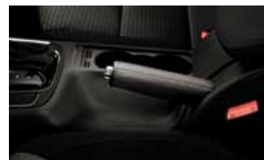
Kožená rukoväť ručnej brzdy (FFA 600 011)