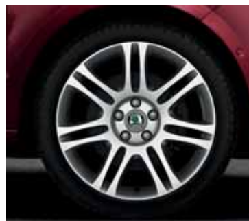
Disk z ľahkej zliatiny Themisto 7,5J x 18" pre pneumatiky 225/40 R18 (CCH 800 001)