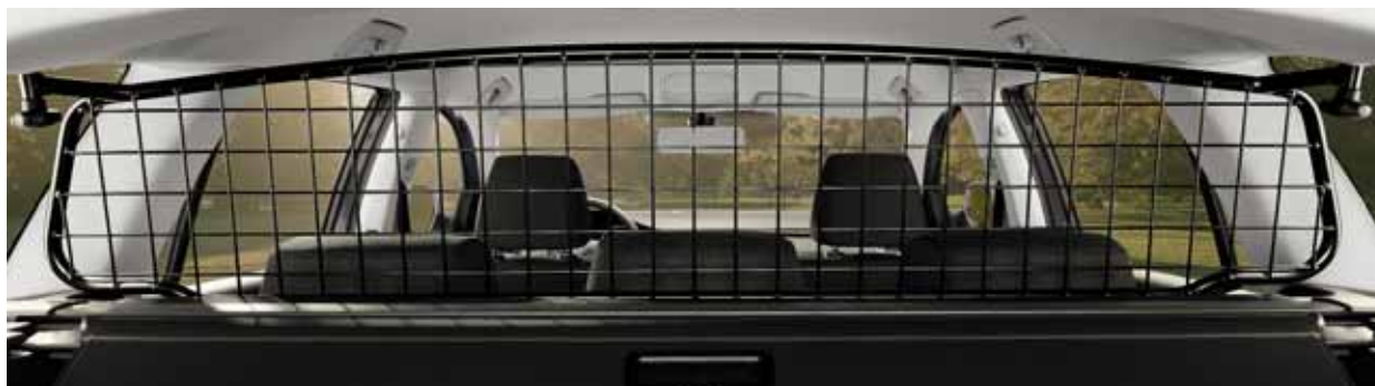
Deliaca mreža pre model Superb Combi (3T9 071 195)