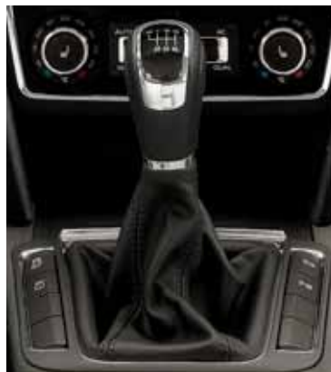
Kožená radiaca páka, 6-stupňový manuál (FFA 800 002) Bez vyobrazenia: 5-stupňový manuál (FFA 800 001)