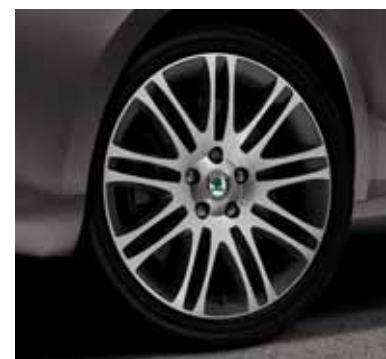
Disk z ľahkej zliatiny Luxon 7,5J x 18", farba antracit sivá pre zvýraznenie športového charakteru, pre pneumatiky 225/40 R18 (CCX 800 004A)