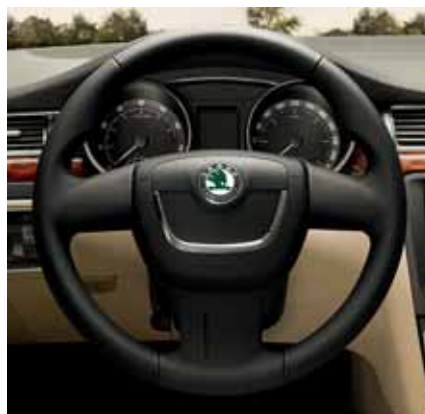
Volant potiahnutý kožou, štvorramenný (FBA 800 000); trojramenný (FBA 800 001)