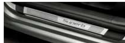
Dekoratívne prahové lišty s vložkou z ušľachtilej ocele vpredu i vzadu (KDA 800 002)