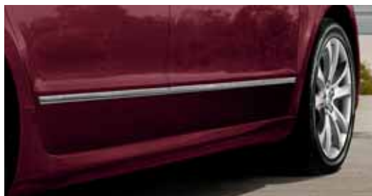
Chrómované bočné ochranné lišty (KGA 800 001)