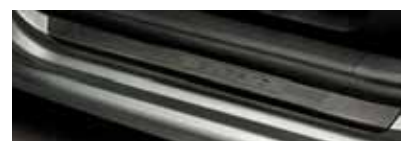
Prahové lišty čierne (KDA 800 001)