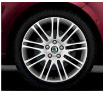
Disk z ľahkej zliatiny Luxon 7,5J x 18" pre pneumatiky 225/40 R18 (CCX 800 004); vo farbe antracit sivá (CCX 800 004A)