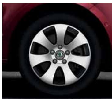
Disk z ľahkej zliatiny Spectrum 7,0J x 16" pre pneumatiky 205/55 R16 (CCR 800 001)