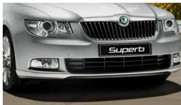
Spoiler predného nárazníka (FAA 800 003)