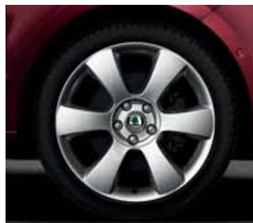
Disk z ľahkej zliatiny Luna 7,5J x 18" pre pneumatiky 225/40 R18 (CCA 800 001)