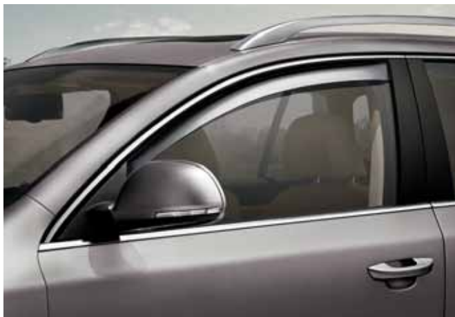
Deflektory predných okien (KCD 809 001)