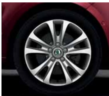
Disk z ľahkej zliatiny Trifid 7,5J x 17" pre pneumatiky 225/45 R17 (CCR 800 004)