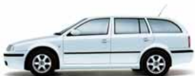
Strieborná Brilliant metalíza