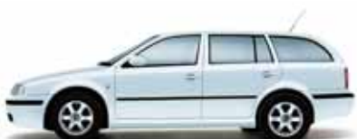
Strieborná Brilliant metalíza