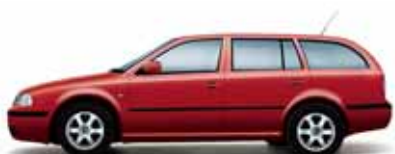
Červená Corrida uni

Modely vybavené Športovým paketom je možné objednať vo farbách: