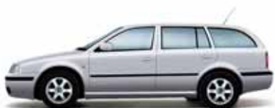
Biela Candy uni