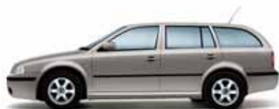
Běžová Cappuccino metalíza