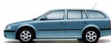
Sivá Satín metalíza