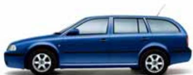
Modrá Storm metalíza