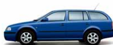
Modrá Dynamic uni