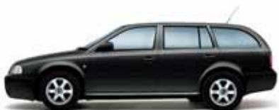
Čierna Magic s perleťovým efektom

Modely vybavené Športovým paketom je možné objednať vo farbách: