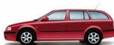
Červená Flamenco metalíza