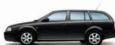
Čierna Magic s perleťovým efektom