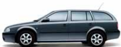
Sivá Anthracite metalíza