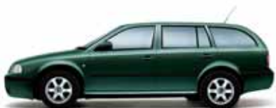
Zelená Highland metalíza