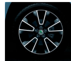
Disky z ľahkých zliatin MATTERHORN 7,0 J × 17", dvojfarebné prevedenie pre pneumatiky 225/50 R17.

○ výbava na želanie ● štandardná výbava - nie je v ponuke