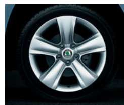
Disky z ľahkých zliatin DOLOMITE 7,0 J × 17" pre pneumatiky 225/50 R17.