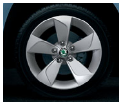
Disky NEVIS z ľahkých zliatin 7,0 J × 16" 215/60 R16.