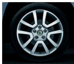
Disky z ľahkých zliatin SPITZBERG 7,0 J × 17" pre pneumatiky 225/50 R17.